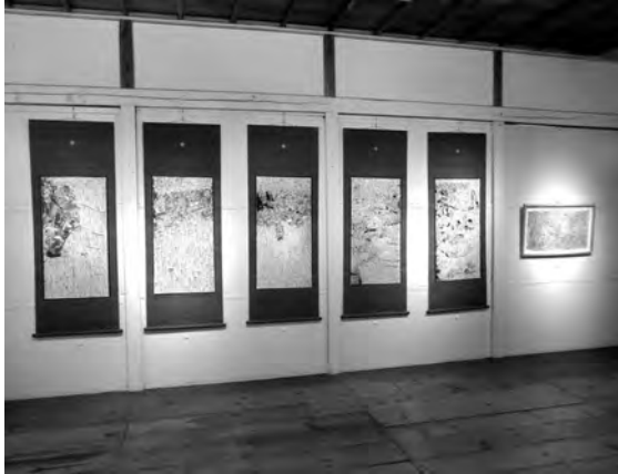
▲富塚純光さんの作品。