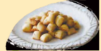
チーズチップ★ ブラックペッパーが効いていて、少し大人向け の味になっています。 お酒との相性もぴったりです! ¥186+税