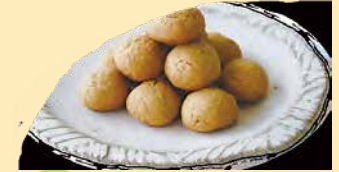
きなこクッキー★ 国内産のきなこを使用したクッキーです。 素朴な味でつつい手が伸びてしまう商品です。 *鹿児島産粗糖を使用しておりません。 ¥278+税