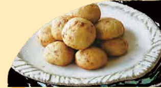
いちじクッキー 栄養価が高いいちじくを贅沢に使用した一口 サイズのクッキーです。 独特の味わいとプチプチした食感をお楽しみ ください。 ¥278+税