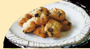
チョコバナナクッキー★ バナナとチョコチップの王道の組合せが やっぱりおいしい! 卵不使用です。 ¥278+税