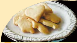
ビスケット 材料そのものの味を生かした素朴なビスケット。 suzukake 人気ナンバーワンです。 ¥250+税