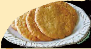
アーモンドクッキー アーモンドダイスの香ばしさがおいしさの秘密です。 ¥278+税