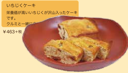
いちじくケーキ 栄養価が高いいちじくが沢山入ったケーキ です。 クルミと一緒に ¥463+税