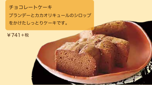
チョコレートケーキ ブランデーとカカオリキュールのシロップ をかけたしっとりケーキです。 ¥741+税