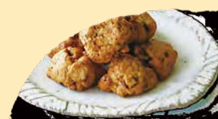
オートミールクッキー 鉄分とミネラルたっぷりのオートミール (オーツ 麦を潰して乾燥させた物) とレーズンを使った ロッククッキーです。 ¥278+税