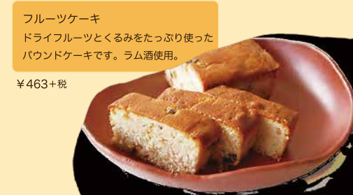
フルーツケーキ ドライフルーツとくるみをたっぷり使った パウンドケーキです。ラム酒使用。 ¥463+税