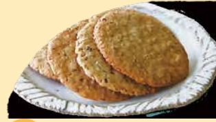
ごまビスケット (平) バターとゴマの風味とほんのり塩味をお楽しみ ください。 ¥278+税