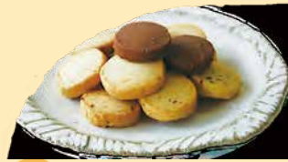
ミックスクッキー プレーン・チーズ・くるみ・ココア・レーズンの 5種類の味をお楽しみいただけます。 ¥278+税