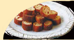
酒粕のラスク クセになる甘み・コク・食感。他にはないラスク。 *鹿児島産粗糖を使用しておりません。 ¥278+税