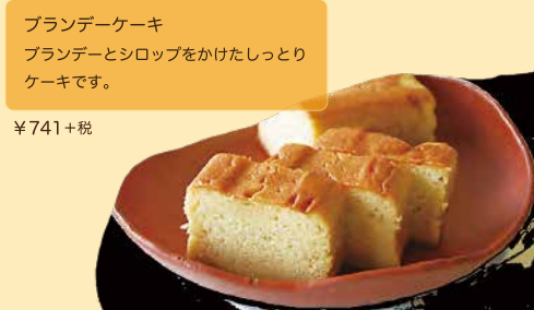
ブランデーケーキ ブランデーとシロップをかけたしっとり ケーキです。 ¥741+税