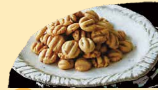
ごまビスケット (粒) 栄養一杯のごまをたくさん使った、甘さ控えめ 香ばしいビスケットです。 ¥278+税