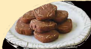
チョコアーモンドクッキー チョコとアーモンドが相性がぴったり。 ちょっとリッチなクッキーです。 ¥278+税