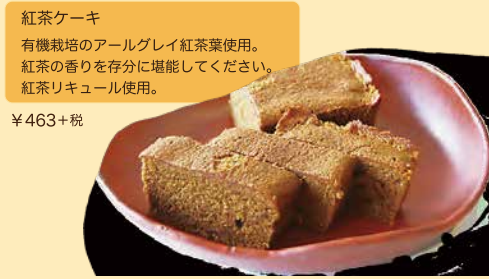
紅茶ケーキ 有機栽培のアールグレイ紅茶葉使用。 紅茶の香りを存分に堪能してください。 紅茶リキュール使用。 ¥463+税