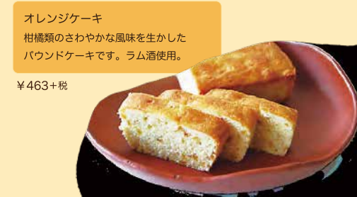
オレンジケーキ 柑橘類のさわやかな風味を生かした パウンドケーキです。ラム酒使用。 ¥463+税