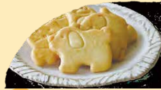
動物ビスケット 動物の形をした、かわいいビスケット。 ¥250+税